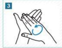
3 Sabunu avuç içimizde iyice köpütelim