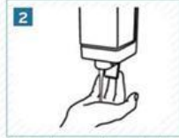
2 Yeterince sabun alalım