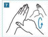
7 Başparmaklarımızı ovalayalım