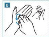
8 Parmak uçlarını avuç içimizde ovalayalım