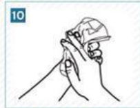
10 Kağıt havluyla kurulayalım