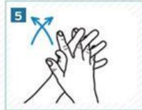
5 Parmaklarımızı iç içe geçirip ovalayalım