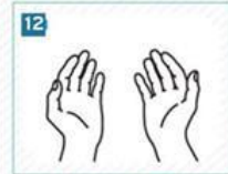
12 Ellerimiz artık tertemiz...