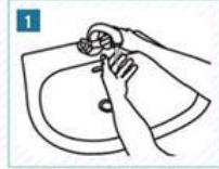
1 Ellerimizi suyla ıslatalım