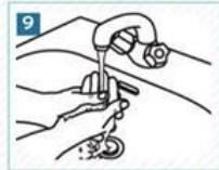
9 Ellerimizi bol suyla durulayalım